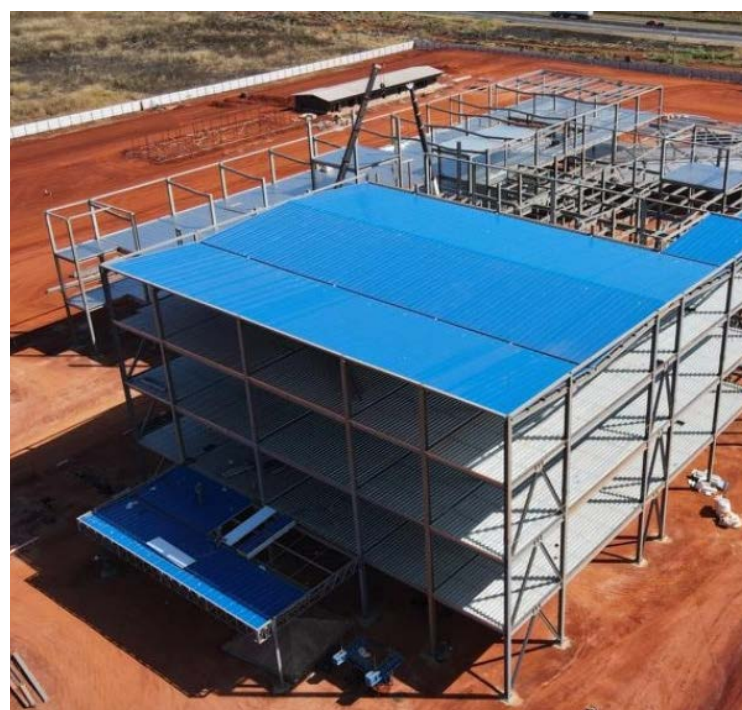
Com investimento orçado em R$ 424,7 milhões, Cora terá área de 44,7 mil metros quadrados

A planta da obra prevê a construção de 148 leitos de internação de pacientes adultos e pediátricos, centro cirúrgico, farmácia, centro de exames por imagem e infusão quimioterápica.