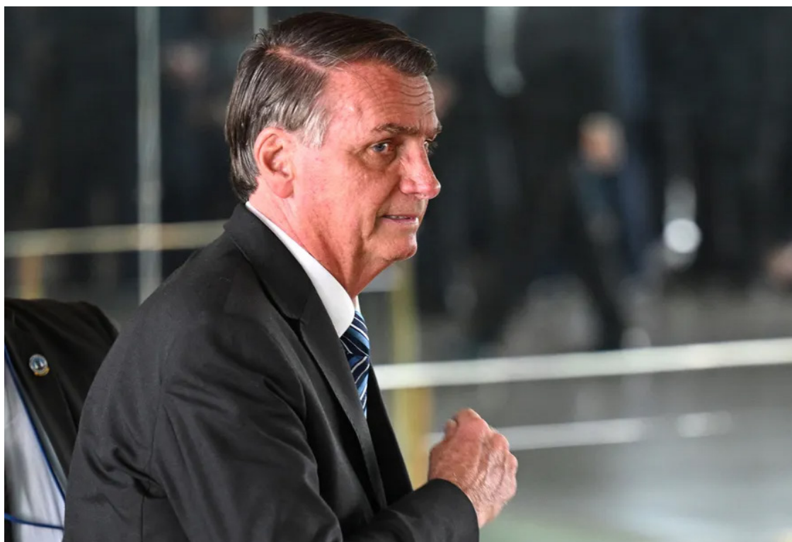
Jair Bolsonaro: Polícia Federal colhe prova provar tentativa de golpe militar

Fontes a par do andamento das apurações disseram à equipe da coluna que o quadro formado a partir das descobertas tanto do inquérito sobre o 12 de dezembro como sobre o 8 de janeiro, e ainda os