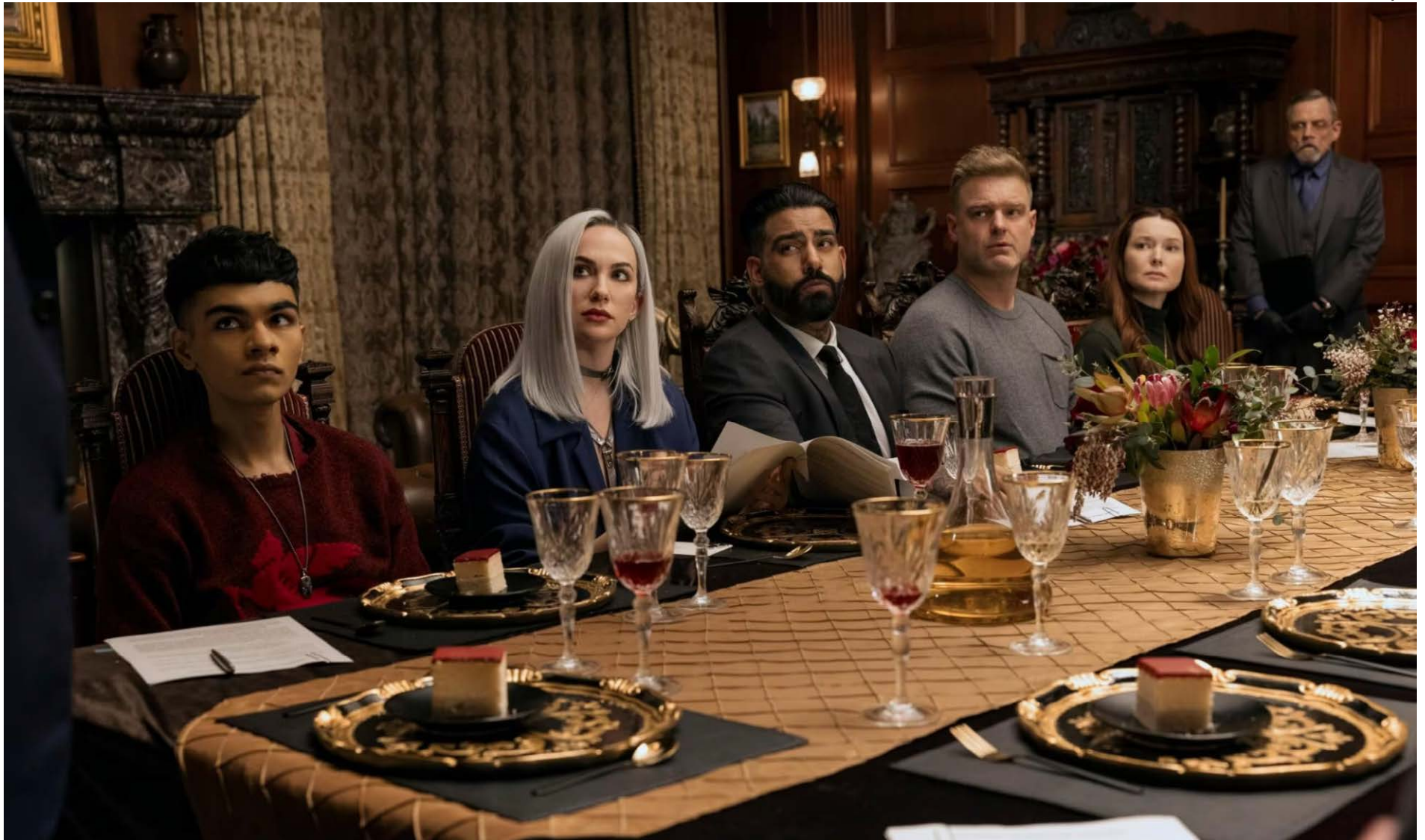
Velhos conhecidos: produção reúne maioria do elenco conjunto que Flanagan conseguiu montar ao longo da carreira