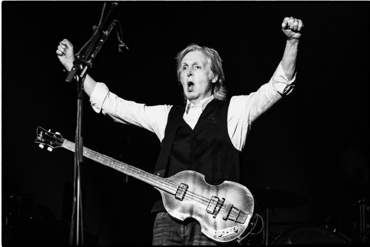
Longe desde 2019: músico fará oito shows em território brasileiro