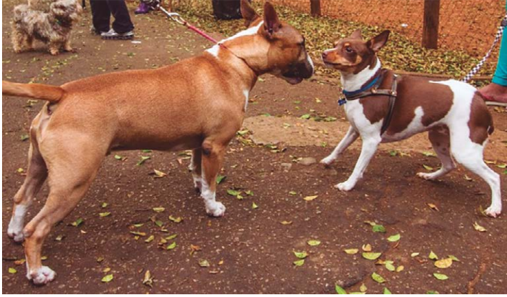
Manifestação é direcionada aos tutores que insistem em circular sem colocar proteção no focinho dos cães, caso daquelas mais agressivos