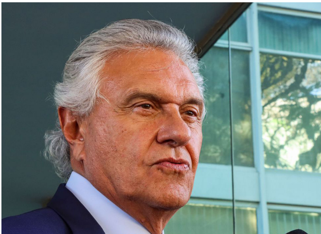
Ronaldo Caiado: nome à disposição para o embate eleitoral de 2026

Ronaldo Caiado reconhece a força política/eleitoral de Jair Bolsonaro, ex-presidente da República, mesmo depois da decretação da sua inelegibilidade pelo Tribunal Superior Eleitoral (TSE), e destaca a boa relação que tem com o liberal. Para o governador de Goiás, Bolsonaro é um aliado que ainda tem, sem dúvidas, um grande poder de