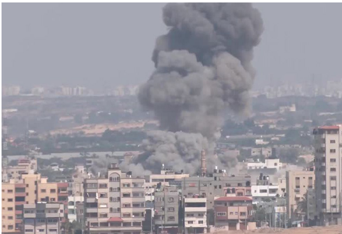
Organizações humanitárias pediram a criação de corredores humanitários para levar ajuda à Faixa de Gaza, e advertiram que os hospitais estavam sobrecarregados com feridos

O conflito começou após militantes do Hamas atacarem Israel, no sábado, levando os confrontos às ruas pela primeira vez em décadas. Ao menos 1.600 mortes ocorreram