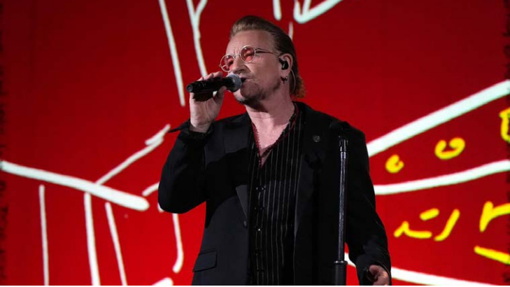
Bono Vox: “cantem para nossos irmãos e irmãs”