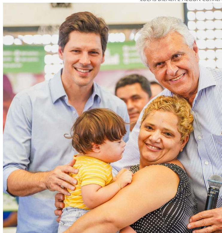
Governador Ronaldo Caiado e Daniel Vilela entregam benefícios sociais a moradores de Luziânia